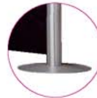
runde Fussplatten aus Metall