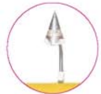
Design - Halogenleuchte