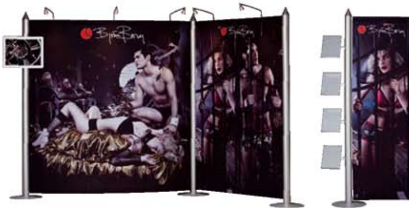
modulares Highline mit Bildschirm