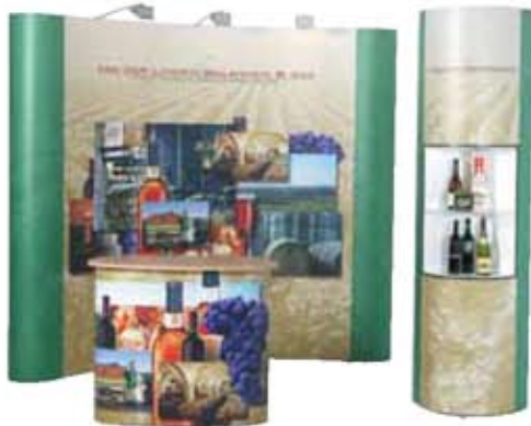
Expofix Prestige in Kombination mit Counterfix und Towerfix