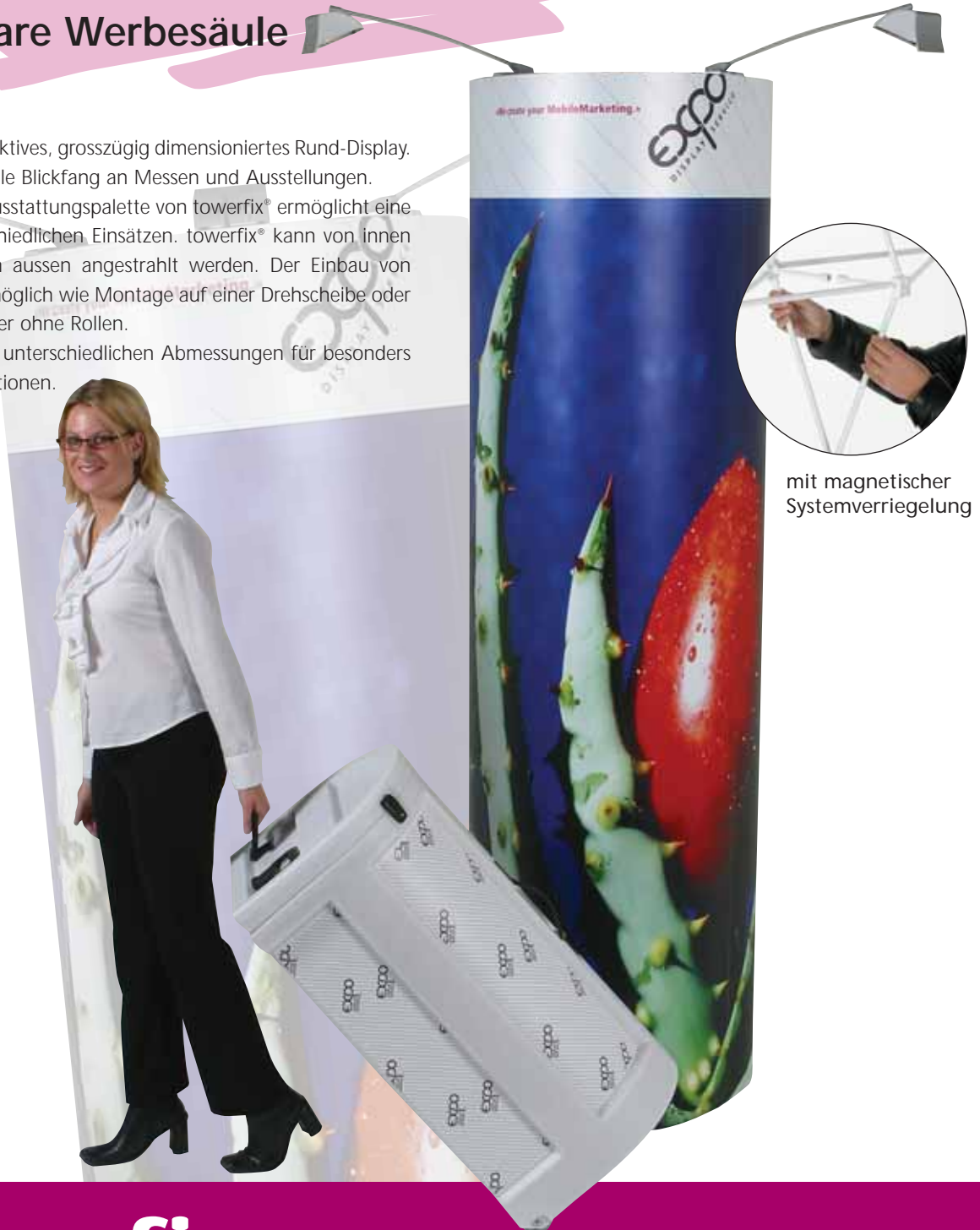
mit magnetischer Systemverriegelung