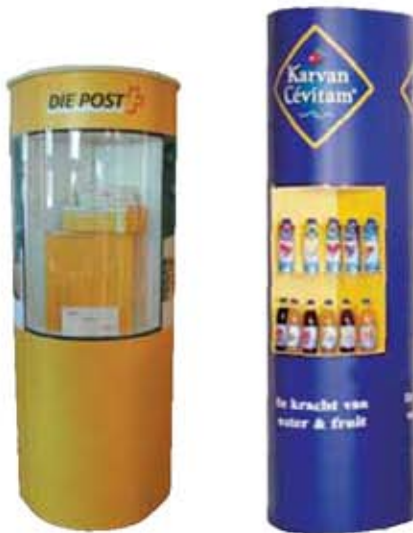
In verschiedenen Höhen, mit Vitrine